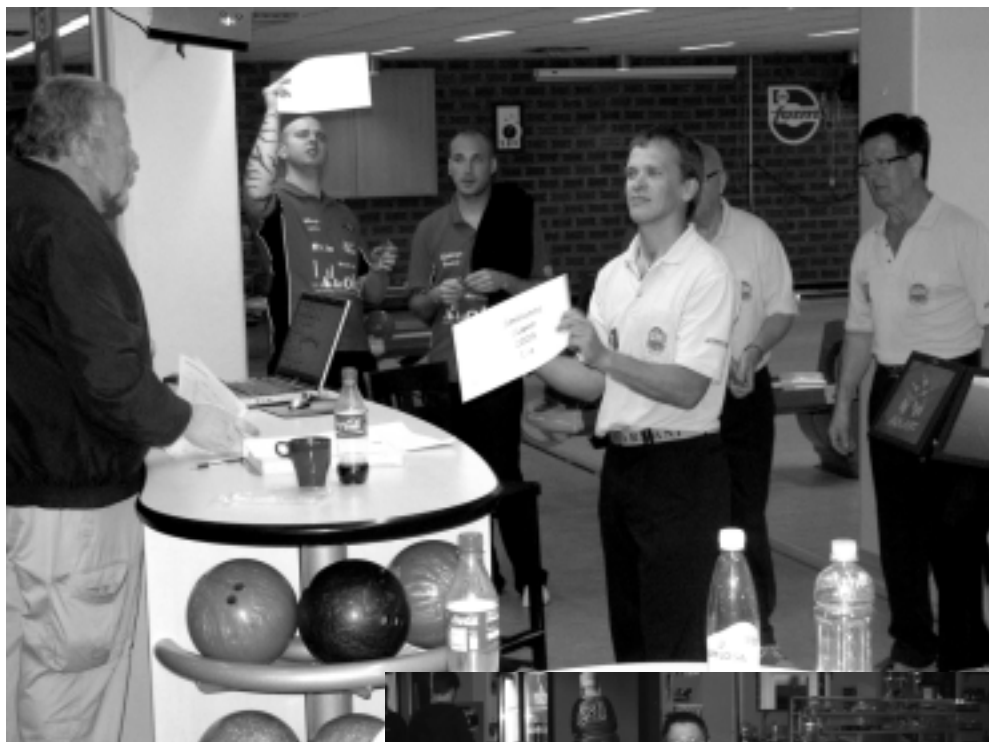
På övre bilden ses våra Smålandsmästare vid prisutdelningen.